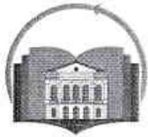
ЦЕНТАР ЗА ОБРАЗОВАЊЕ КРАГУЈЕВАЦ