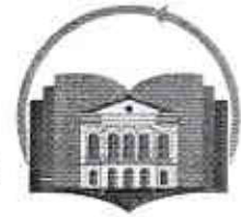
ЦЕНТАР ЗА ОБРАЗОВАЊЕ КРАГУЈЕВАЦ

Трг тополиваца 4 :: 34 000 Крагујевац Контакт телефон: +381 34 201 303 :: Текући рачун: 840-31168845-41 :: ПИБ 107183610 :: ЈБКЈС 80932 :: centar.obrazovanjekg@gmail.com :: csukg.saradnici@gmail.com www.centarzaobrazovanjekg.edu.rs